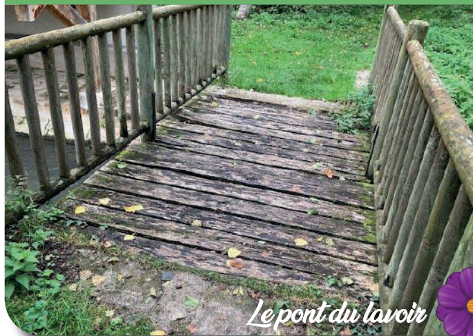
Le pont du lavoir

Nous travaillons aussi à la mise en place de mesures simples visant la valorisation et la protection de nos espaces naturels et de leurs chers hôtes (chauves-souris, insectes, chouettes,