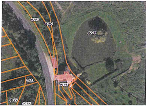
Parcelles cadastrales route de Moret (anciennement La Canarderie)