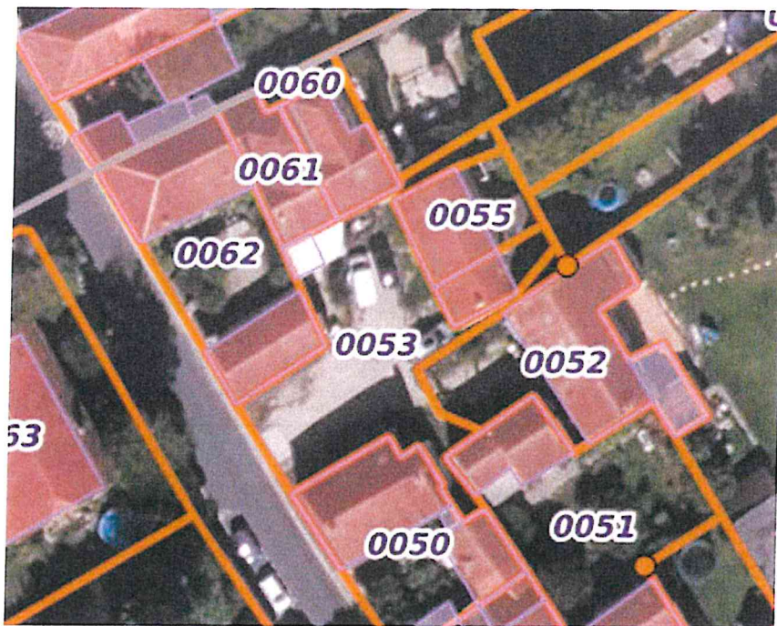
Parcelles cadastrales cour commune rue Grande