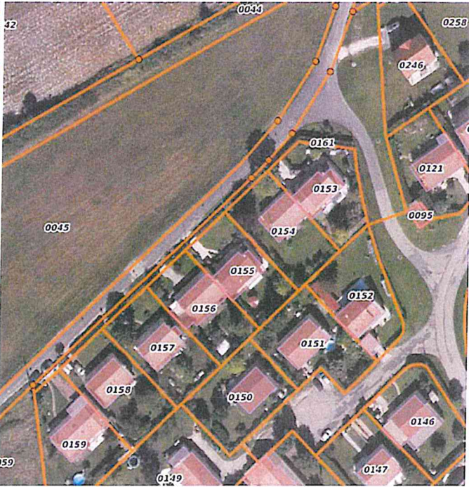
Parcelles cadastrales chemin de Rebours